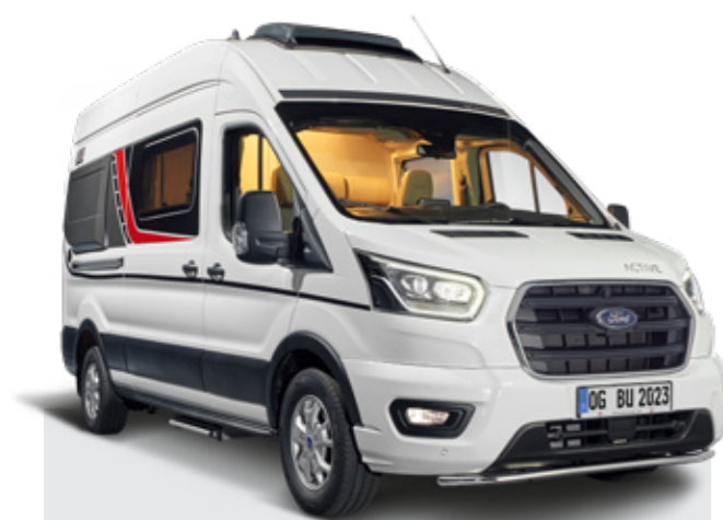
Der grosszügige Spontane