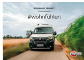
Die Baureihe Delfin finden Sie in einem separaten Folder