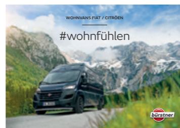
Die Baureihen Campeo und Eliseo finden Sie in einem separaten Folder